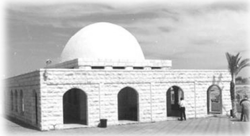
ציון קברו של הבבא סאלי בנתיבות

בכל חודש, מיד כאשר מלאו שבעה ימים מלאים ממולד הלבנה, לעת ערב, הכין את עצמו רבינו המקובל האלקי רבי ישראל אבוהצירא - הבבא סאלי זיע"א, בשמחה גדולה לברכת הלבנה. הוא לא היה מוכן לדחות אפילו לזמן קצר את אמירת תפילה זו, שחז"ל לימדו אותנו שהיא שקולה כקבלת פני השכינה.