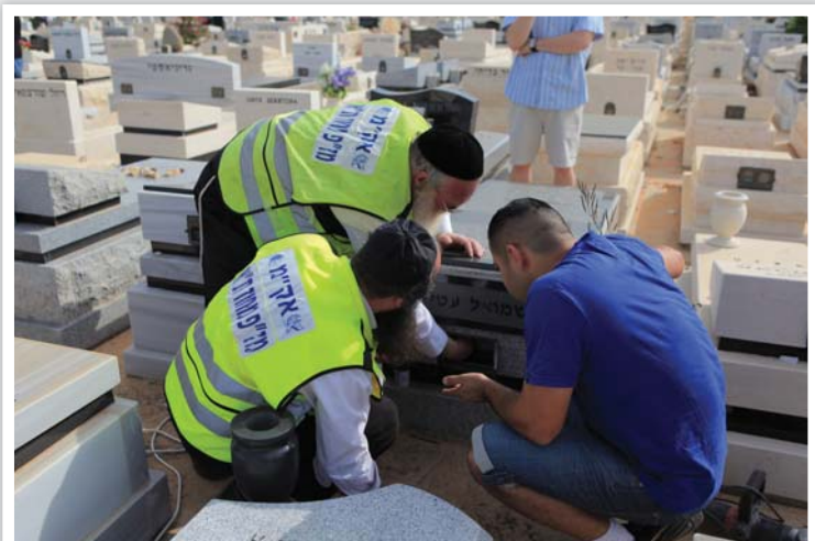
| מתנדבי זק"א ת"א קוברים רקמות בקבר מנוח בבית עלמין ירקון |

יור הועדה הרב יעקב רוז'ה ציין בדבריו כי כל הגורמים המעורבים בפרויקט הלאומי של קבורת אלפי המיכלים עם הרקמות משבחים את העבודה המסורה של זק"א תל אביב הדורשת מיומנות ורגישות רבה הן ביחס לנפטרים והן ביחס למשפחות הכאובות וראויים הם העושים במלאכה לכל שבח.